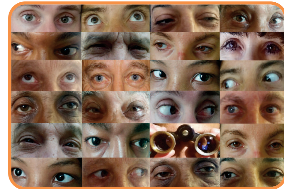
" Droit de regards "

Jeudi 20 et Vendredi 21 OCTOBRE 2022 à MARSEILLE